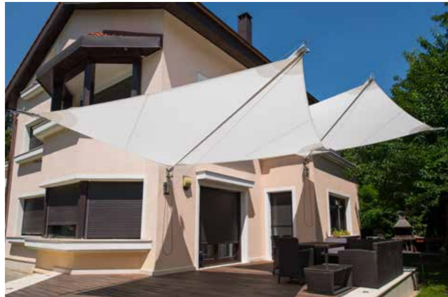
The Outdoor Alchemist

La structure comprend deux voiles qui s'enroulent sur profilé horizontal. Dans sa version autoportante, elle est soutenue par un poteau au design inimitable et à la finition satinée. Si en revanche vous souhaitez fixer Defense au mur, vous aurez besoin d'un étrier en acier inox dont les dimensions d'ancrage seront minimales, de manière à pouvoir associer plusieurs voiles et créer une composition particulièrement suggestive. Defense s'enroule en quelques secondes manuellement ou au moyen d'un moteur télécommandé. Dans la version motorisée, la voile est dotée d'un anémomètre permettant la fermeture automatique en cas de vent fort.