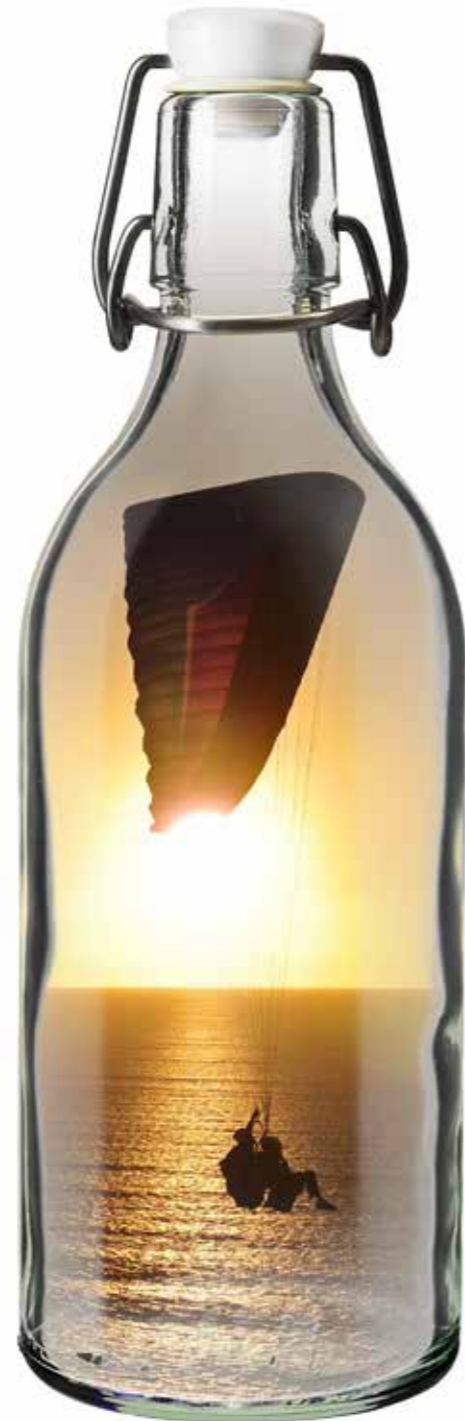
The Outdoor Alchemist